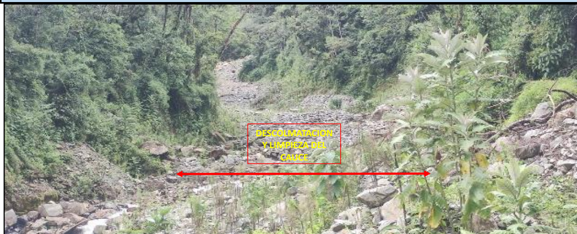
FOTO N° 01: SE OBSERVA COLMATACIÓN EN EL CAUCE DE LA QUEBRADA ICHUICHU - SECTOR ICCHU