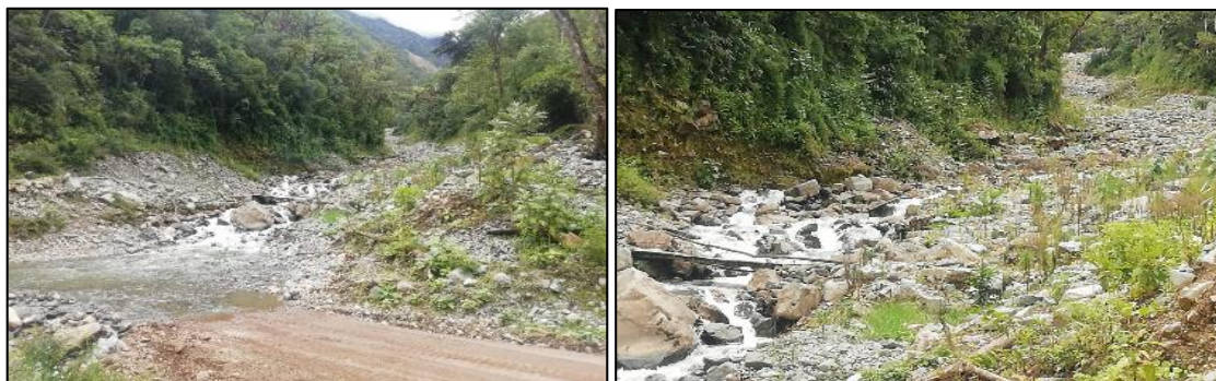
FOTO N° 02 Y N° 03: SE OBSERVA COLMATACIÓN EN EL CAUCE DE LA QUEBRADA ICHUICHU - SECTOR ICCHU